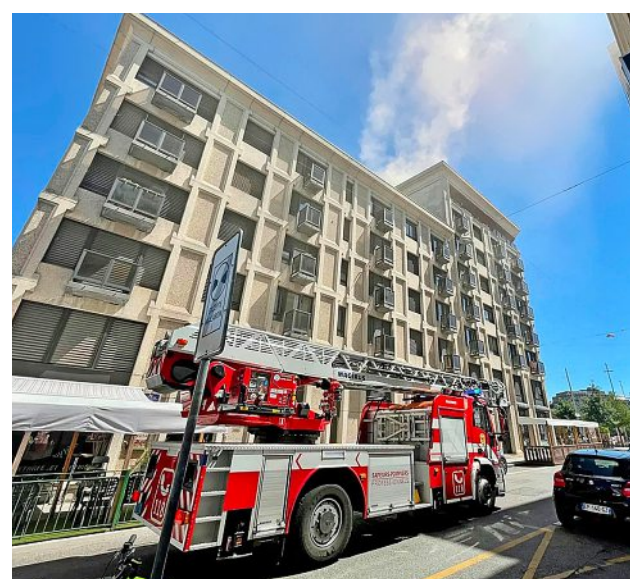
L'incendie, qui a éclaté sous un toit, n'a pas fait de blessés.

C'est le nombre de trams que les Transports publics genevois (TPG) vont acquérir auprès du constructeur suisse Stadler. Ces rames sont attendues en novembre 2024, pour une mise en service durant le premier trimestre de 2025.