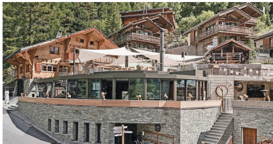
Le Cervo Mountain Resort de Zermatt espère que son offre séduira de nouveaux collaborateurs.