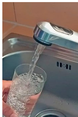
Une réaction chimique lors de la chloration serait en cause. -MFR

Le problème serait survenu lors de la chloration de l'eau,