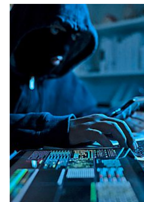
Les personnes arrêtées ne se connaissaient pas.

Au total, 31 agents des forces de l'ordre ont été impliqués