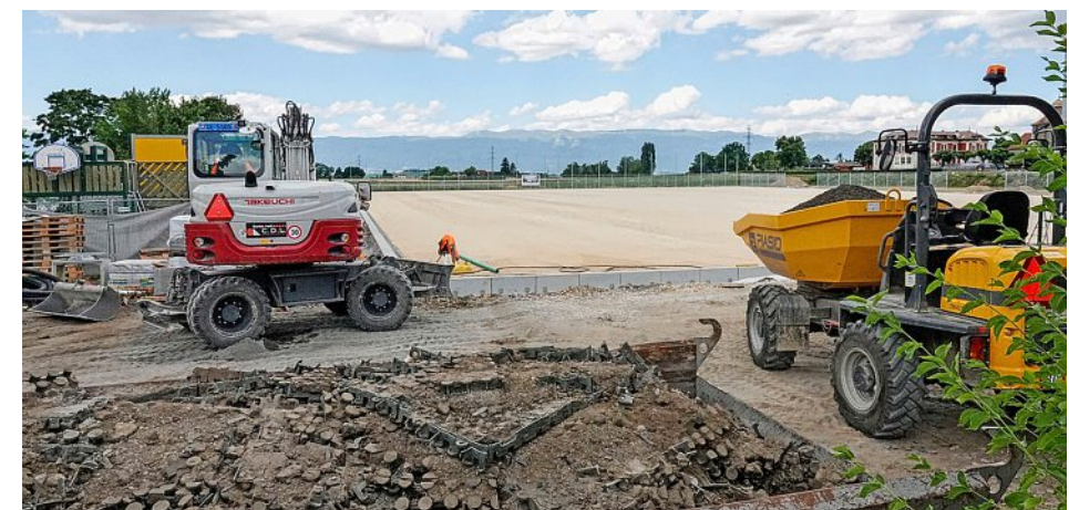
La première décision avait été rejetée alors que les travaux du stade de foot avaient débuté.

GENÈVE Feu vert, feu rouge, puis de nouveau feu vert. Les amateurs de football de Bardonnex peuvent respirer: la construction d'un terrain de football synthétique attendu depuis des années sera achevée d'ici à la fin de l'été. La Surveillance des communes a cassé la décision des élus bardonnexiens d'annuler le crédit de construction de 2,7 millions qu'ils avaient accepté avant de le rejeter à la faveur d'une nouvelle majorité.