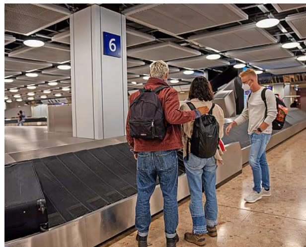
Certaines valises arrivent plusieurs jours après les passagers. -V. LAM

rabytes de données: «C'est gigantesque comme capacité de stockage», précise l'officier. Parmi les interpellés, deux sont récidivistes. Trois ont été mis à la disposition du Ministère public, dont l'un, suspecté d'autres infractions, est en détention depuis. Ces individus, présumés innocents, encourrent 5 ans de prison au plus ou une peine pécuniaire pour pornographie. -LÉONARD BOISSONNAS