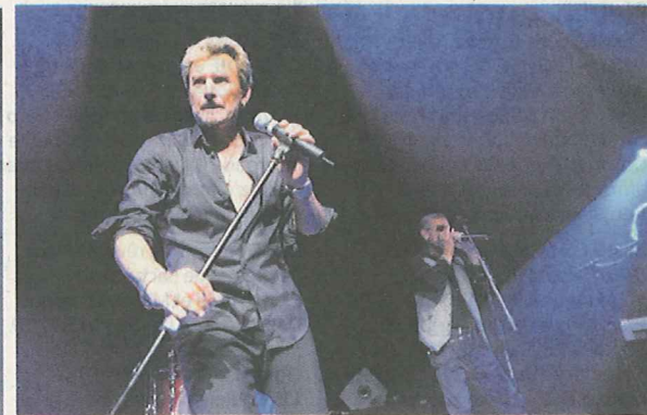
Johnny Hallyday plus vrai que nature et Jean-Pierre Foucault dans le rôle du maître de cérémonie.