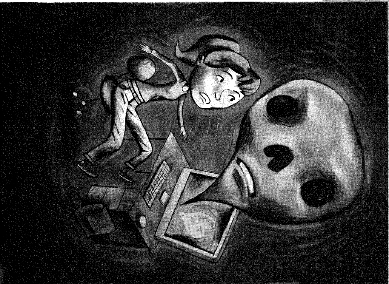
ILLUSTRATION DENIS ADAM

Plus de 90% des adolescents romands communiquent chaque jour sur les réseaux sociaux. S'ils s'y montrent très sentimentaux, ils peuvent aussi faire preuve d'une violence ravageuse. Une mine d'enseignements pour les sociologues.