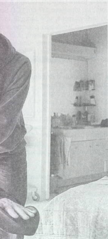
la comédie Intouchables .

iquement à la première séance ur les autres de la même journée. s de réservation par téléphone ou r internet. Renseignements : www.seeeden.com . et 02 40 83 06 02.