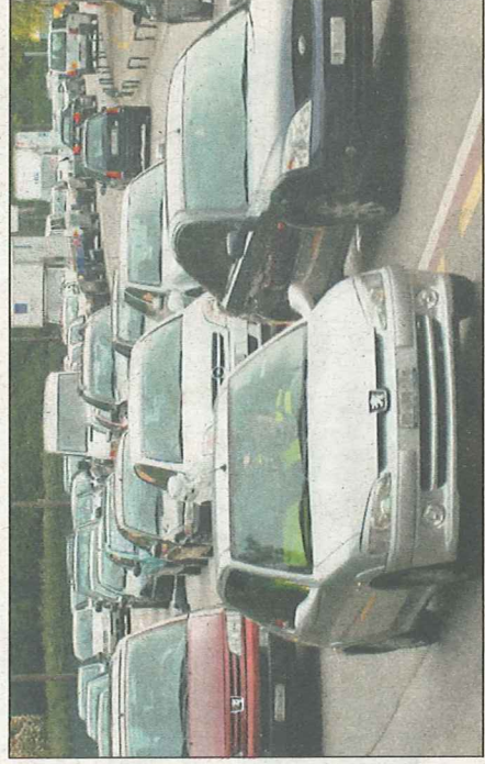
La location de voitures est un appât fréquent des arnaqueurs pour générer des versements bancaires.

Ces filous n'hésitent pas à arroger des titres d'avocat ou de notaire. Ils annexent à leurs correspondances nombre de clichés flatteurs à leur propos. Et de préciser, comme mise en garde: «Il y a lieu de porter une attention particulière lors de la recherche d'un logement via les sites Internet; les escrocs parvenant à modifier des annonces initialement authentiques. Cependant, les objets proposés sont bien plus onéreux dans la réalité, voire n'existent tout simplement pas. Les auteurs de ces délits agissent depuis l'Afrique. En cas d'annonce douteuse, il est judicieux de prendre contact avec le propriétaire du site internet afin que celui-ci effectue les contrôles nécessaires et la supprime s'il s'avère qu'elle est frauduleuse.» M.V.