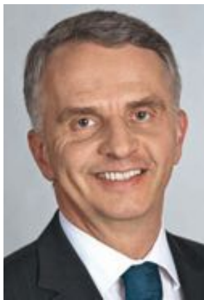
Didier Burkhalter, Conseiller fédéral

Internet, réseaux sociaux, smartphones, jeux sur ordinateurs: les médias numériques fascinent et enrichissent notre quotidien, notre vie professionnelle et bien plus encore. Certaines questions se posent toutefois concernant l'utilisation en fonction de l'âge et la protection de nos enfants et adolescents contre les risques possibles tels que la violence, la pornographie ou les contacts indésirables.